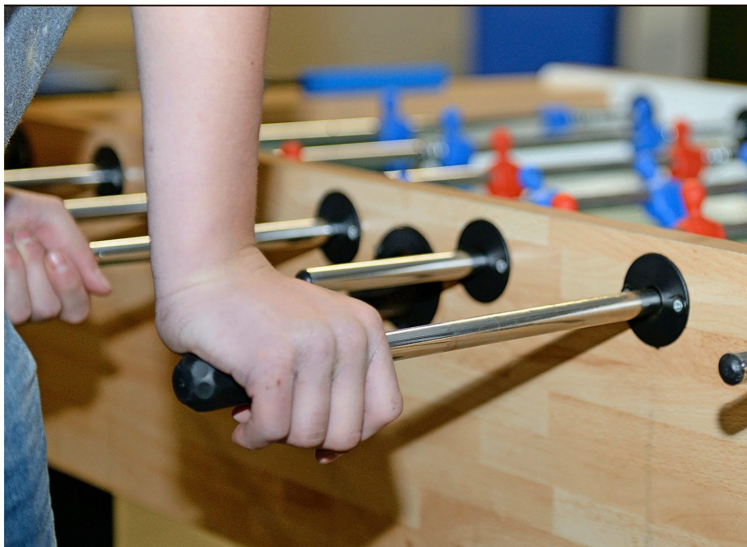
Der Jugendtreff konzentriert sich auf die 12- bis 18-Jährigen.